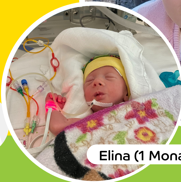
Elina (1 Monat)