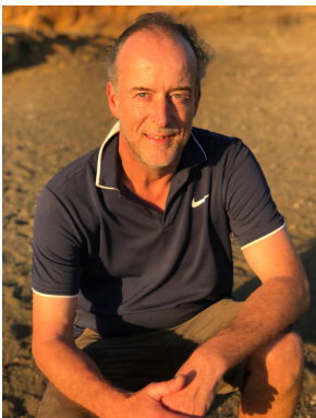
Veranstalter: Dr. Markus Schmid

Die Bedrohungen durch Umweltbelastungen nehmen täglich zu mit massiven negativen Folgen für unsere Gesundheit. Wie belastet bin ich und wie kann ich mich schützen? Diesen Fragen gehen wir in diesem Vortrag auf den Grund.