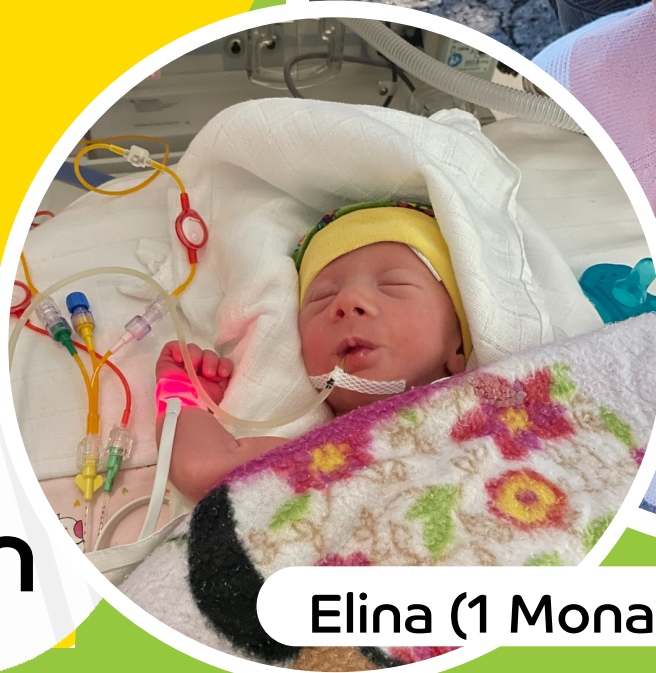
Elina (1 Monat)