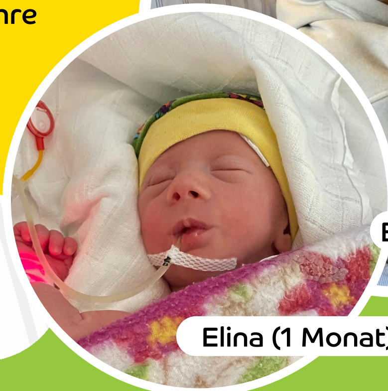
Elina (1 Monat)