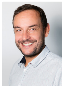
Veranstalter: Ludwig Loretz