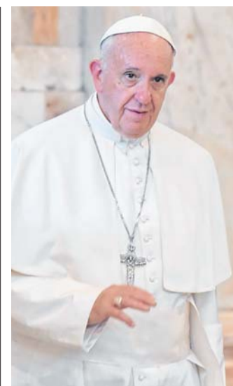
80. Geburtstag Papst feiert mit Gottesdienst /D10