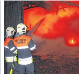
Der Stall konnte nicht mehr gerettet werden.