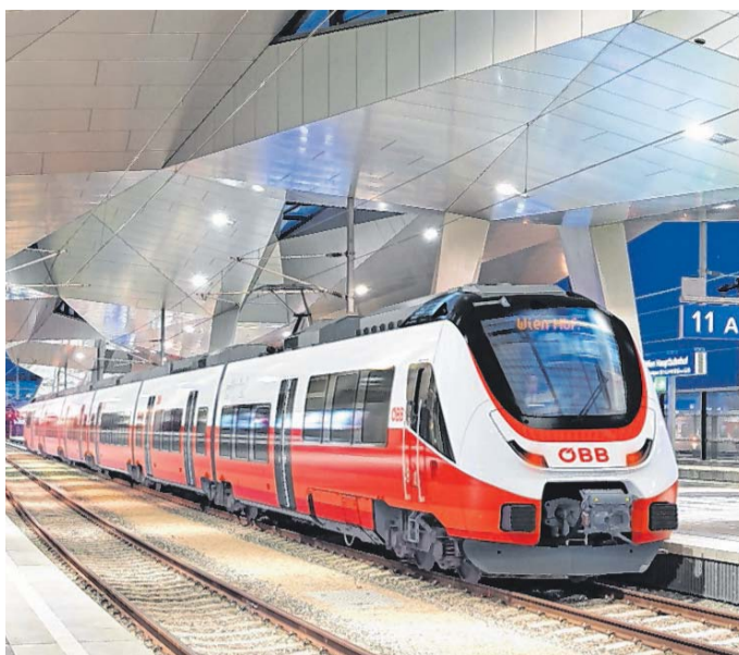
Züge fürs Land aus Brandenburg Vorbereitungen für Zugbau laufen /A9