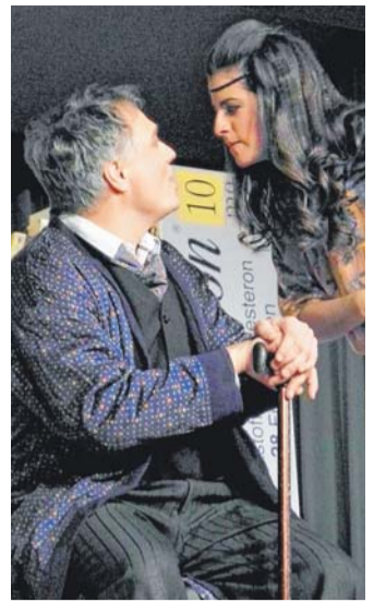
Uraufführung Leandobühne hat Molière variiert /D2