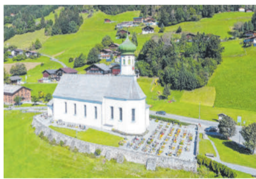
Die Arbeiten am Sockel der Pfarrkirche Bartholomäberg sind abgeschlossen. PFARRE