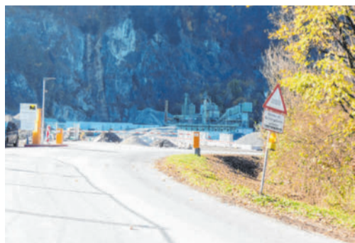
Der Fuß- und Radweg führt mitten durch das Betriebsgelände. MÄSER

BLUDENZ Die Arbeiten für die Sanierung und Restaurierung des Sockelputzes der Pfarrkirche Bartholomäberg konnten abgeschlossen werden. Nach den Vorgaben der Diözese und des Bundesdenkmalamtes wurde der schadhafte Putz abgetragen, die Kirchenmauern im untersten Bereich gegen eintretendes Wasser abgedichtet und in der Folge neu verputzt.