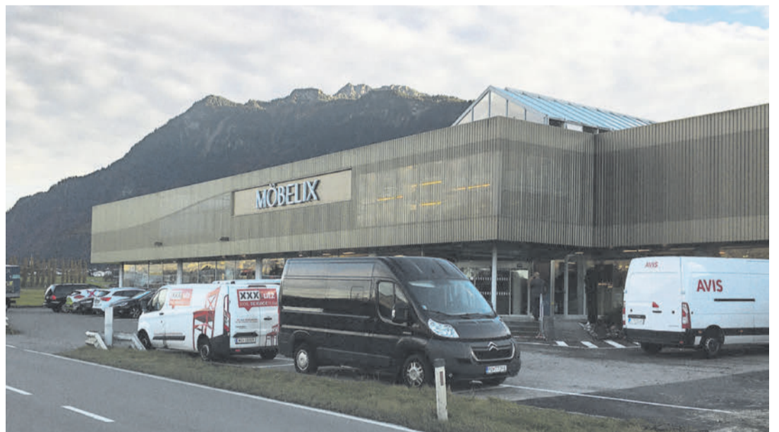
Möbelix in Nenzing, Bundesstraße 205, eröffnet neu und feiert mit großartigen Eröffnungsangeboten. Ein Besuch der neuen Filiale zahlt sich jetzt besonders aus.

Aber auch die Beratung kommt bei Möbelix nicht zu kurz. So werden bei Möbelix Einbauküchen und Küchenblöcke mittels 3D-Computerplanung für Sie millimetergenau geplant. Sie bekommen somit sofort eine