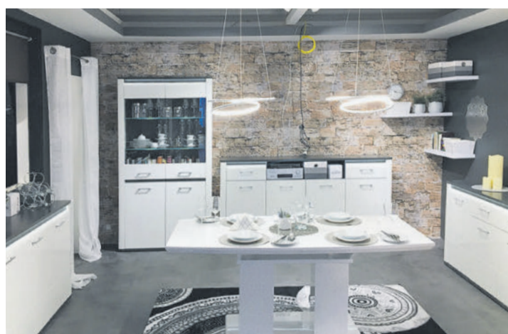
1000e Eröffnungsangebote zu sagenhaft günstigen Preisen erwarten Sie bei Möbelix in Nenzing.

und Sonderposten verhandelt. Bei diesen Preisen muss man einfach zugreifen. Nützen Sie diese einmalige Gelegenheit und schauen Sie beim neuen Möbelix in Nenzing, Bundesstraße 205, oder bei der mitfeiernden Möbelix-Filiale in Dornbirn, vorbei. Im modernen Stil präsentiert man bei Möbelix, wie man heutzutage wohnt, ohne viel Geld ausgeben zu müssen. Egal, ob Sie Möbel, Wohnaccessoires, Textilwaren, Teppiche oder Leuchten benötigen – ein Besuch bei Möbelix ist es allemal wert.