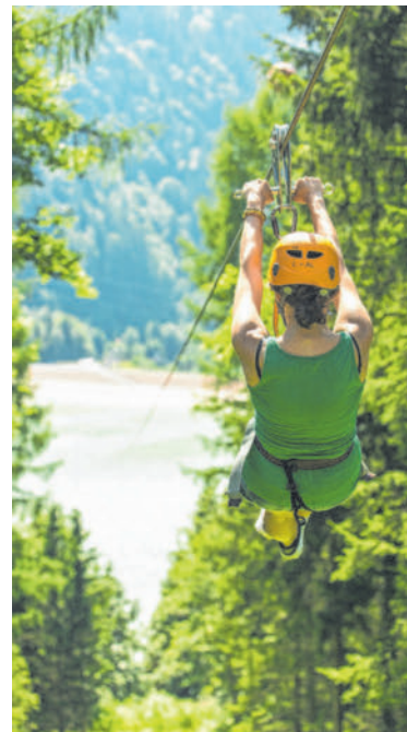
Ein besonderer Adrenalinkick ist die Fahrt über den Stausee mit dem Flying Fox.

Mit 91 Übungen ist der Waldseilpark-Golm der größte in Vorarlberg und verspricht Kletterspaß für Groß und Klein. Wer lieber über den See fliegt, ist beim Flying-Fox-Golm an der richtigen Stelle. Ein mehr als 500 Meter langes Stahlseil verbindet die Startplattform beim Waldseilpark mit der Landeplattform beim Alpine-Coaster-Golm. Mit bis zu 70 km/h ist dieser Flug über den See ein Erlebnis der Extraklasse. Bei der spektakulären Erlebnisbahn mit dem Alpine-Coaster eröffnen sich dem Fahrer einzigartige Ausblicke auf die umliegende Bergwelt. Golm's Forschungspfad lädt zum Entdecken ein. Das Murmeltier Golmi führt auf einer Strecke von 3,5 Kilometer durch seinen Lebensraum und erklärt den kleinen und großen Wanderern interessante Facetten der Tier- und Pflanzenwelt im Bergwald.