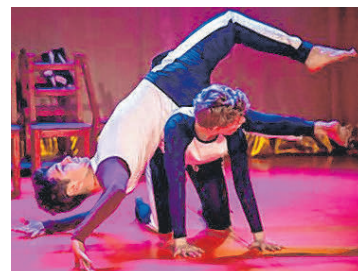
Die Jungs aus Schweden machen den Anfang beim „Luaga und Losna“ Festival.