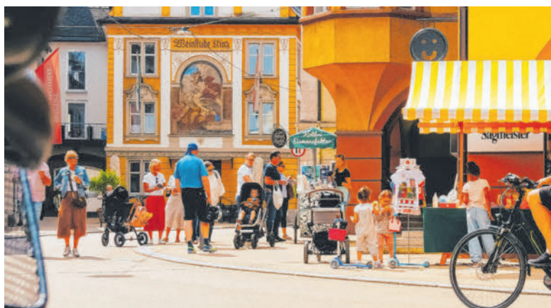
Kommenden Samstag lädt die Bregenzer Stadt zum entspannten Bummeln im Freien.