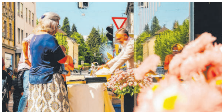
Die zahlreichen Marktstände laden zum stressfreien Durchstöbern und Flanieren ein.

Dieser Aktionstag im Freien findet in den Sommermonaten jeden ersten Samstag im Monat statt. Straßensperren der Anton-Schneider-Straße, der Kirchstraße und der Römerstraße (für Anrainer, Stadtbuss und Blaulichtorganisationen frei) ermöglichen ein großzügiges Flanieren durch die Einkaufsstraßen mit entsprechend großem Abstand. Vorbei schauen lohnt sich.