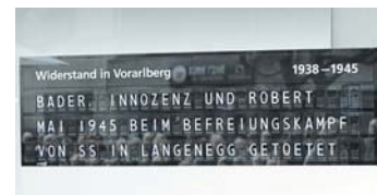
Das Widerstandsdenkmal im Fokus.