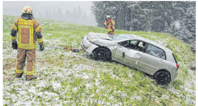
Der 35-Jährige musste von Rettungskräften aus dem Pkw geborgen werden.

In Dornbirn Heilgereute-Kreuzen auf Höhe der Diskothek „Nightstar“ kollidierte gegen 10 Uhr ein 35-jähriger Lenker mit einem Linienbus. Der in Dornbirn wohnhafte