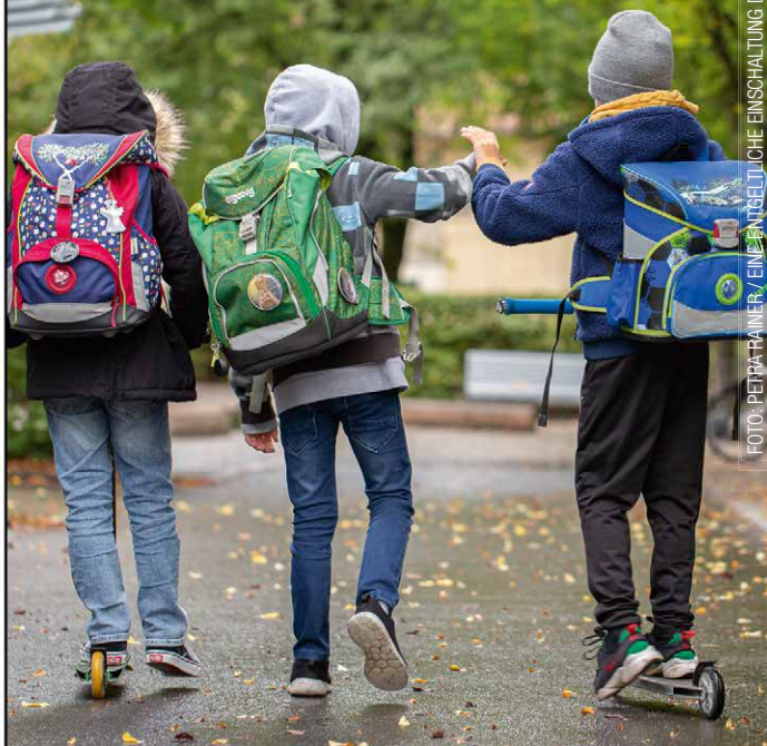
EINE WENIG WEITLICHE EINSCHALTUNG DES LANDES VORARLBERG