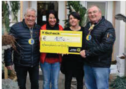
Scheckübergabe an den Verein „Geben für Leben - Leukämiehilfe Österreich“

Derzeit warten viele Patienten, die u.a. an Leukämie oder einer Blutkrankheit erkrankt sind, auf eine lebensrettende Stammzellenspende. Alleine in Vorarlberg sind es derzeit rund zehn Patienten – mehr als die Hälfte davon sind Kinder, die gesunde Stammzellen für eine erfolgreiche Therapie benötigen. „Es ist ein Wettlauf gegen die Zeit und wir sind für jede Spende dankbar“,