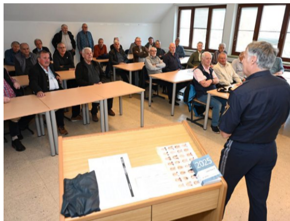
Die Schulklasse bei ihrer Reunion.